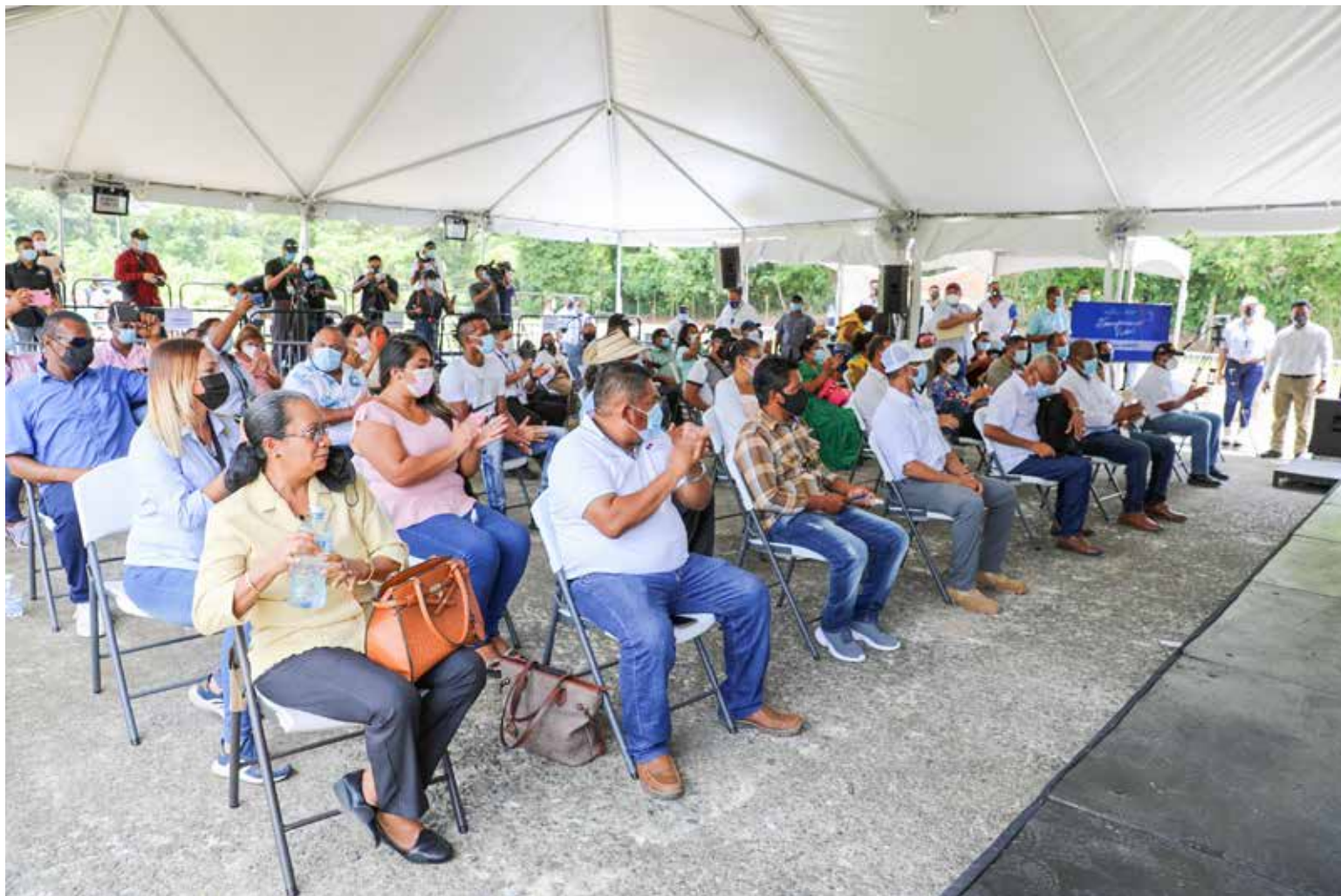
Moradores de Boca del Drago en las actividades del Gobierno Nacional que le llevan soluciones sociales.