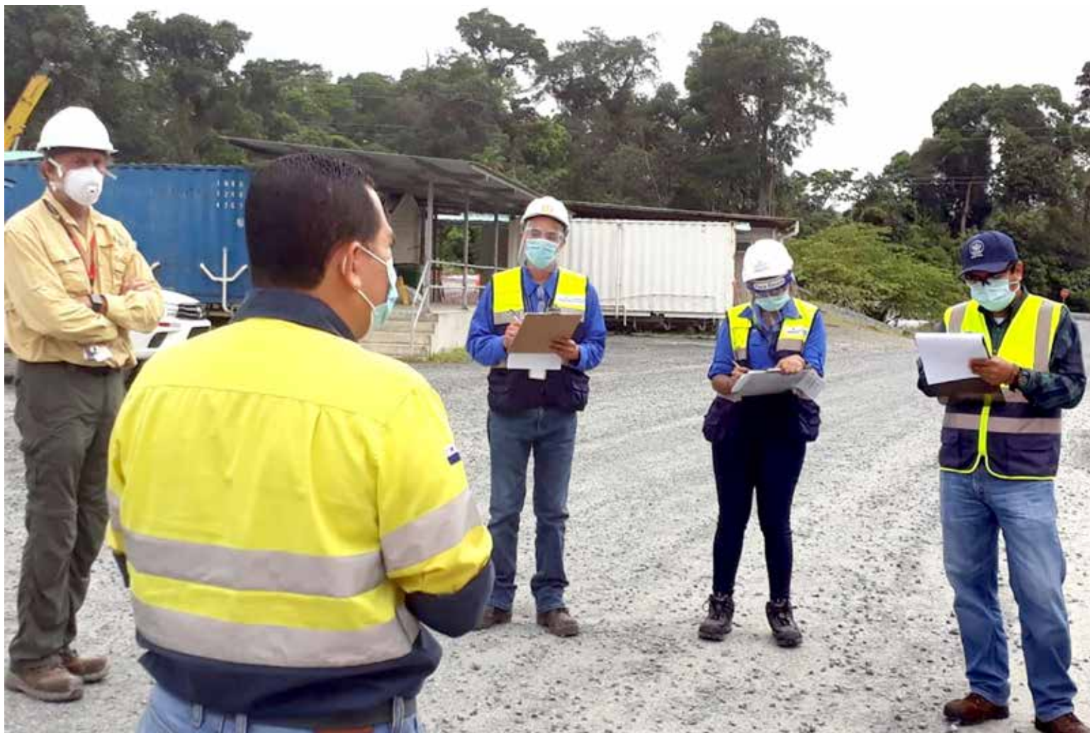
Mitradel verifica el cumplimiento de bioseguridad en la empresa Cobre Panamá.