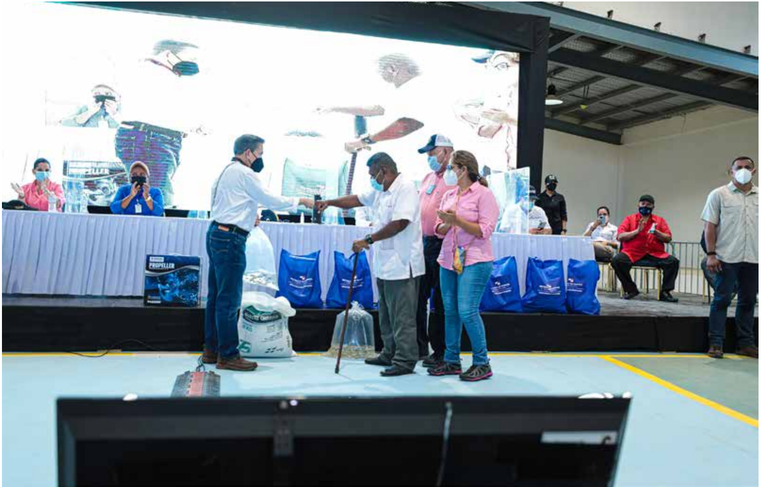
Alevines de tilapia roja para productores de Bocas del Toro entregados por el presidente de la República, Laurentino Cortizo Cohen.