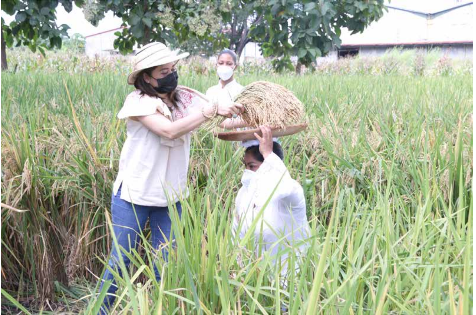
La ministra de Gobierno, Janaina Tewaney Mencomo, en la cosecha de arroz en el centro penitenciario de Llano Marín, en Penonomé.