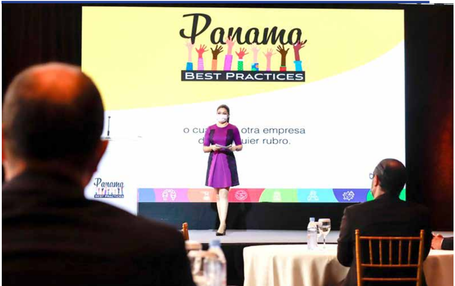
Presentación del Proyecto "Panama Best Practices", demostrando que como país estamos preparados con todas las medidas de bioseguridad requeridas ante la pandemia que se vive a nivel mundial.