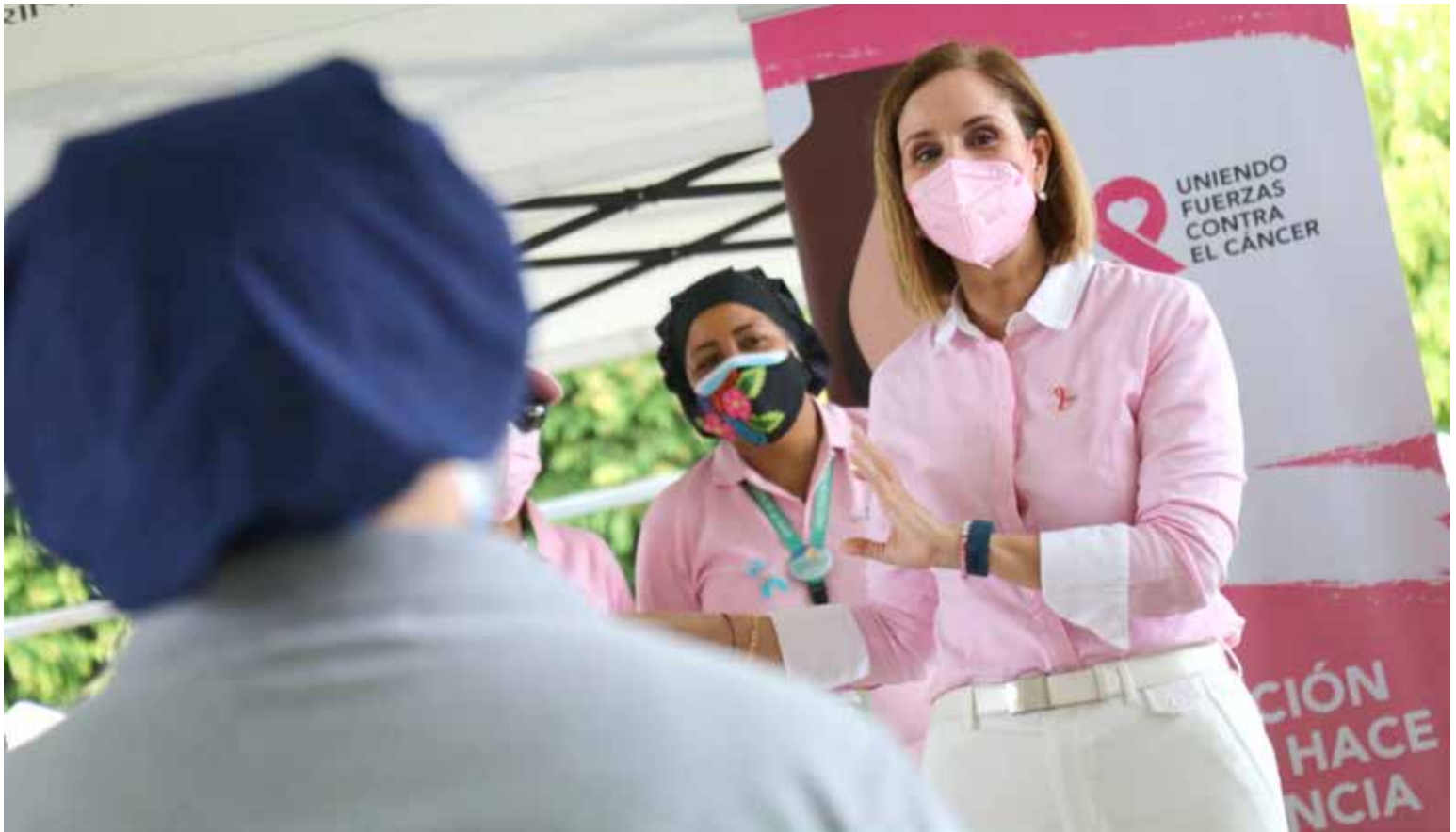
La primera dama de la República, Yasmín Colón de Cortizo, visita las instalaciones de Salud Sobre Ruedas.