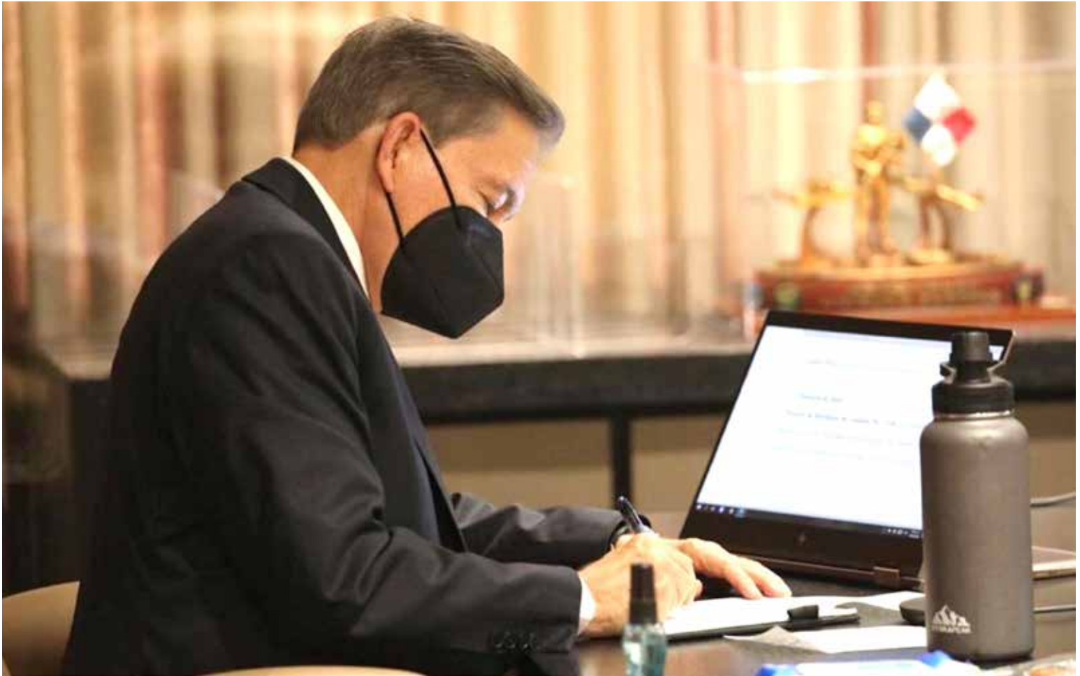
El presidente de la República, Laurentino Cortizo Cohen, busca inversiones para reactivar la economía panameña.