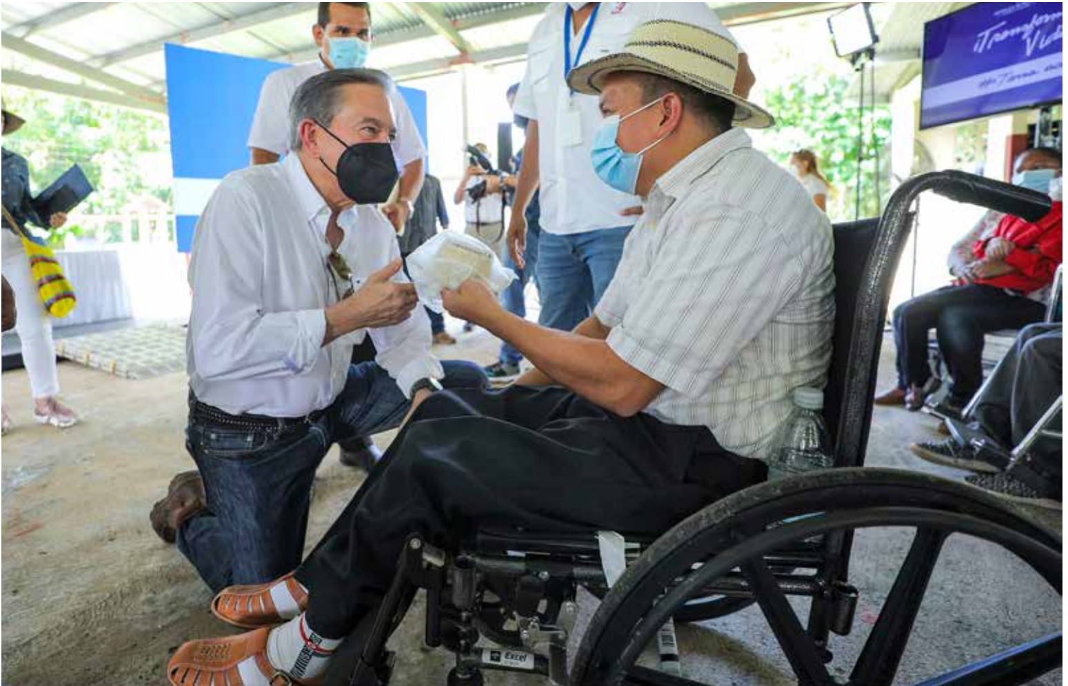
El presidente de la República, Laurentino Cortizo Cohen, recibe un sombrero tejido por las manos del artesano Diógenes Zamora, en El Cacao.