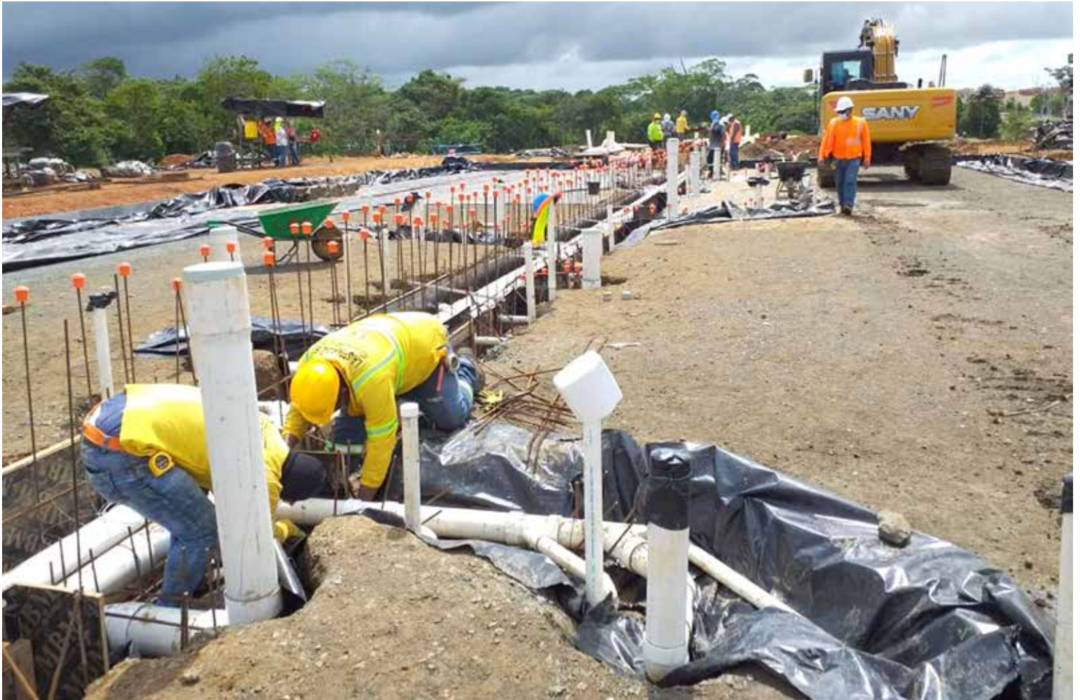
Los trabajadores realizan labores de fundación de los primeros edificios de la megaobra habitacional.