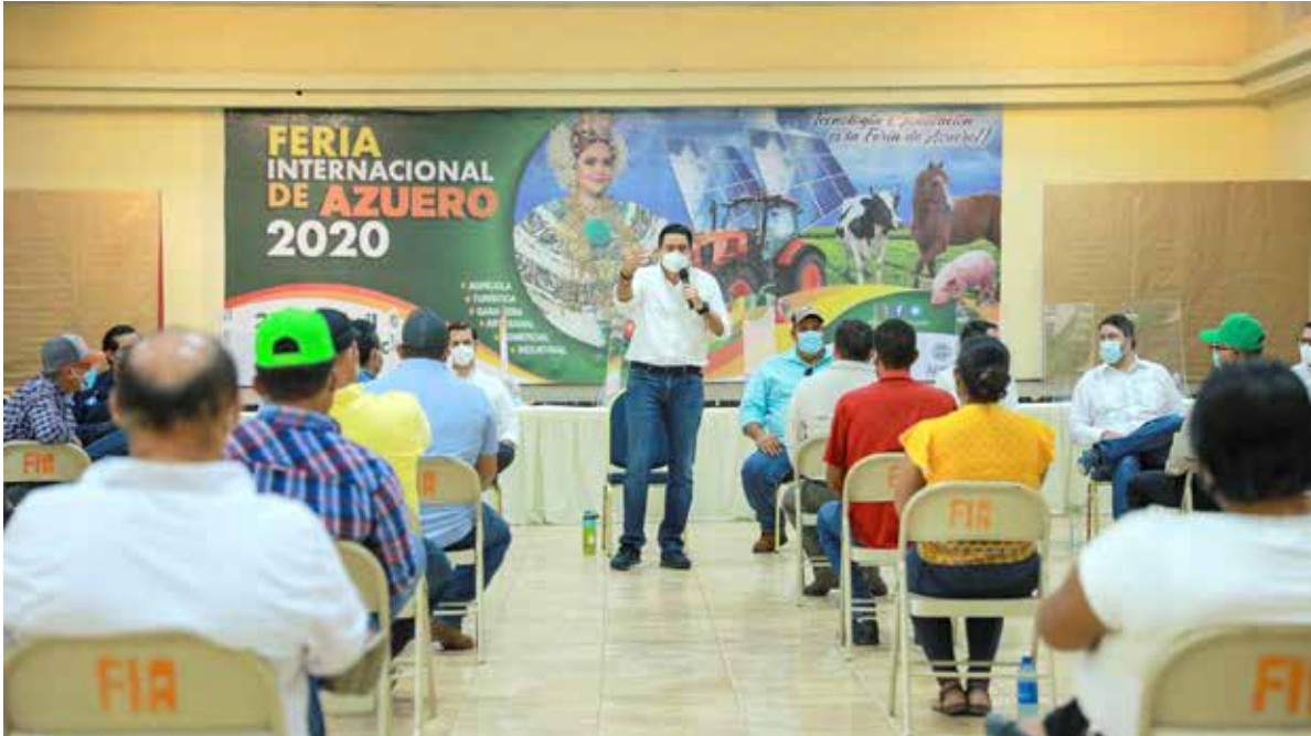
El vicepresidente de la República, José Gabriel Carrizo Jaén, reunido con empresarios de Herrera y Los Santos para buscar diversas formas de reactivar la economía.