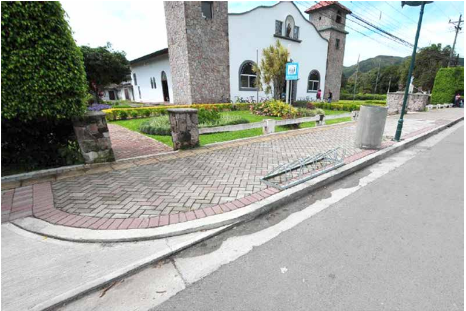
La nueva cara de El Valle de Antón