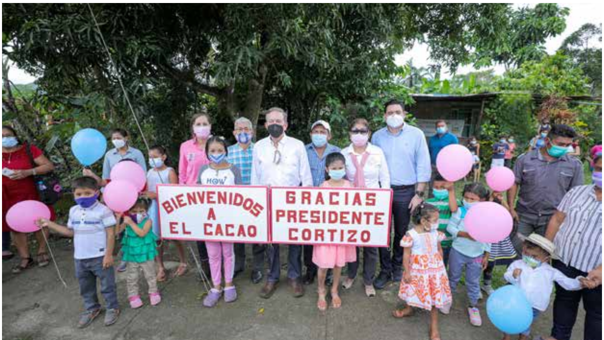
El presidente de la República, Laurentino Cortizo Cohen, y el vicepresidente José Gabriel Carrizo Jaén, atienden las necesidades de corregimientos vulnerables.