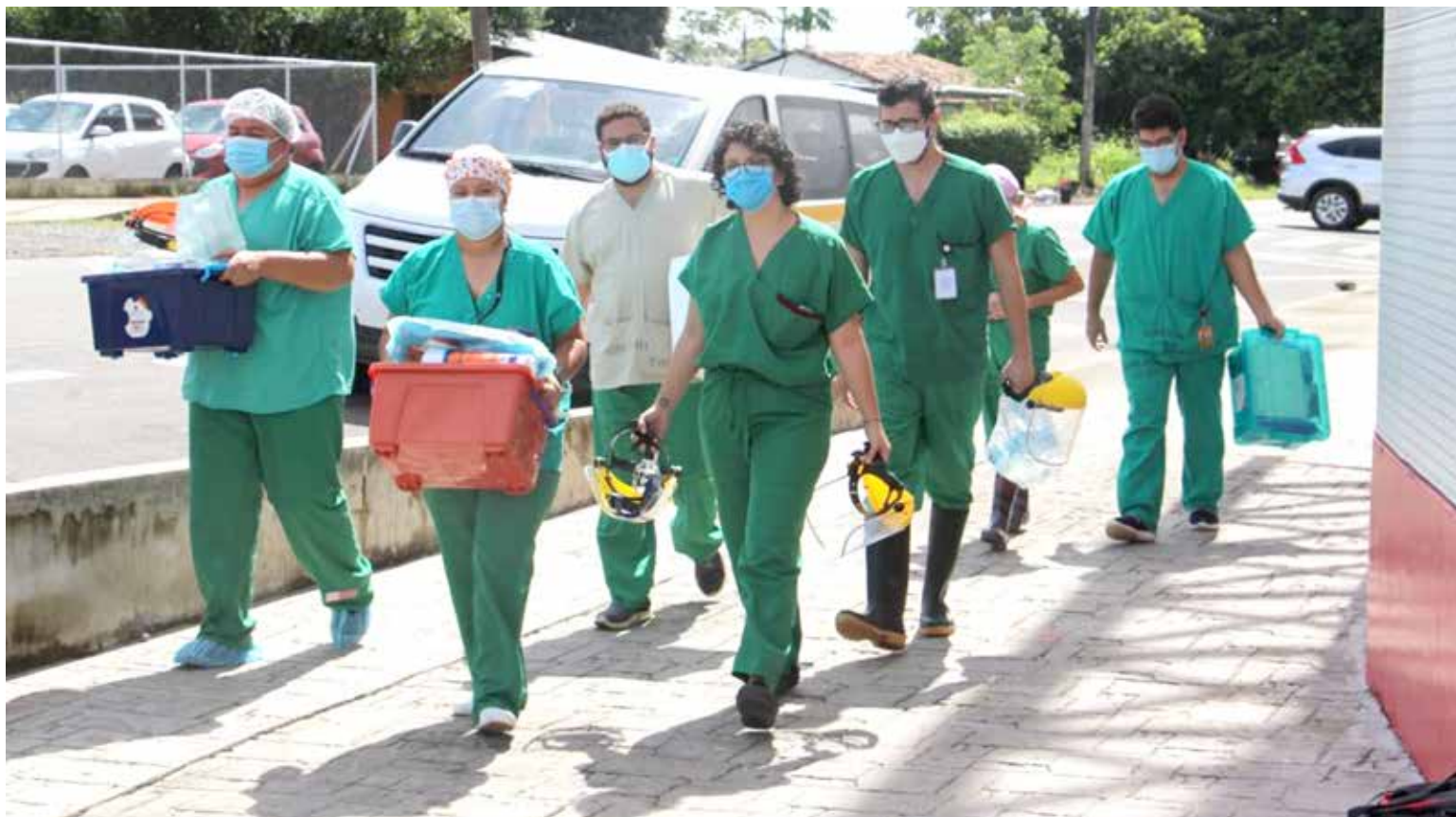
Equipo del Ministerio de Salud recorre comunidades en la provincia de Chiriquí para pruebas de hisopado.