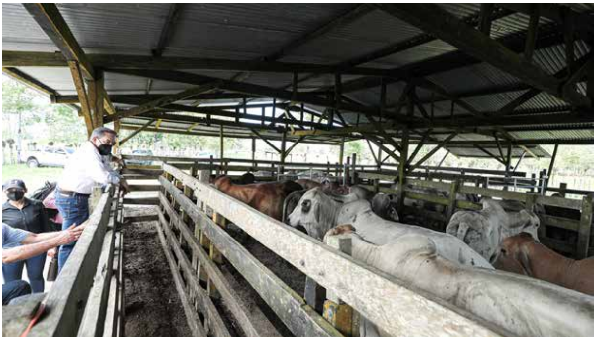
En la finca del ganadero Félix Beitía, en Changuinola, el presidente de la República, Laurentino Cortizo Cohen, entregó 30 sementales de alta genética y 400 kilos de semillas de pasto mejorado.