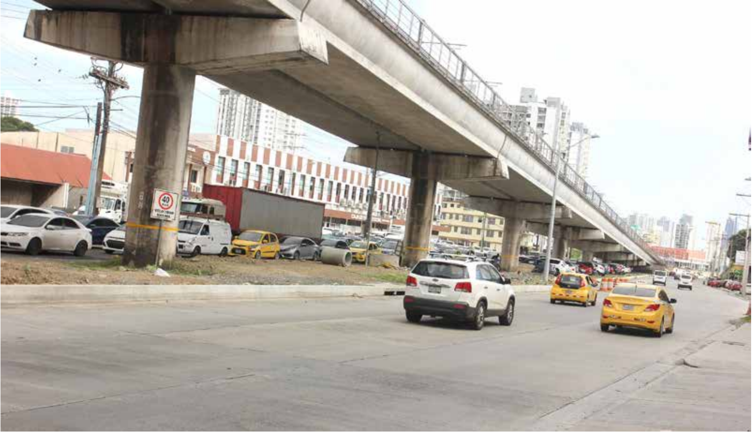
La rehabilitación y ampliación del tramo Plaza Ágora-Estación San Isidro presenta un avance del 80%.