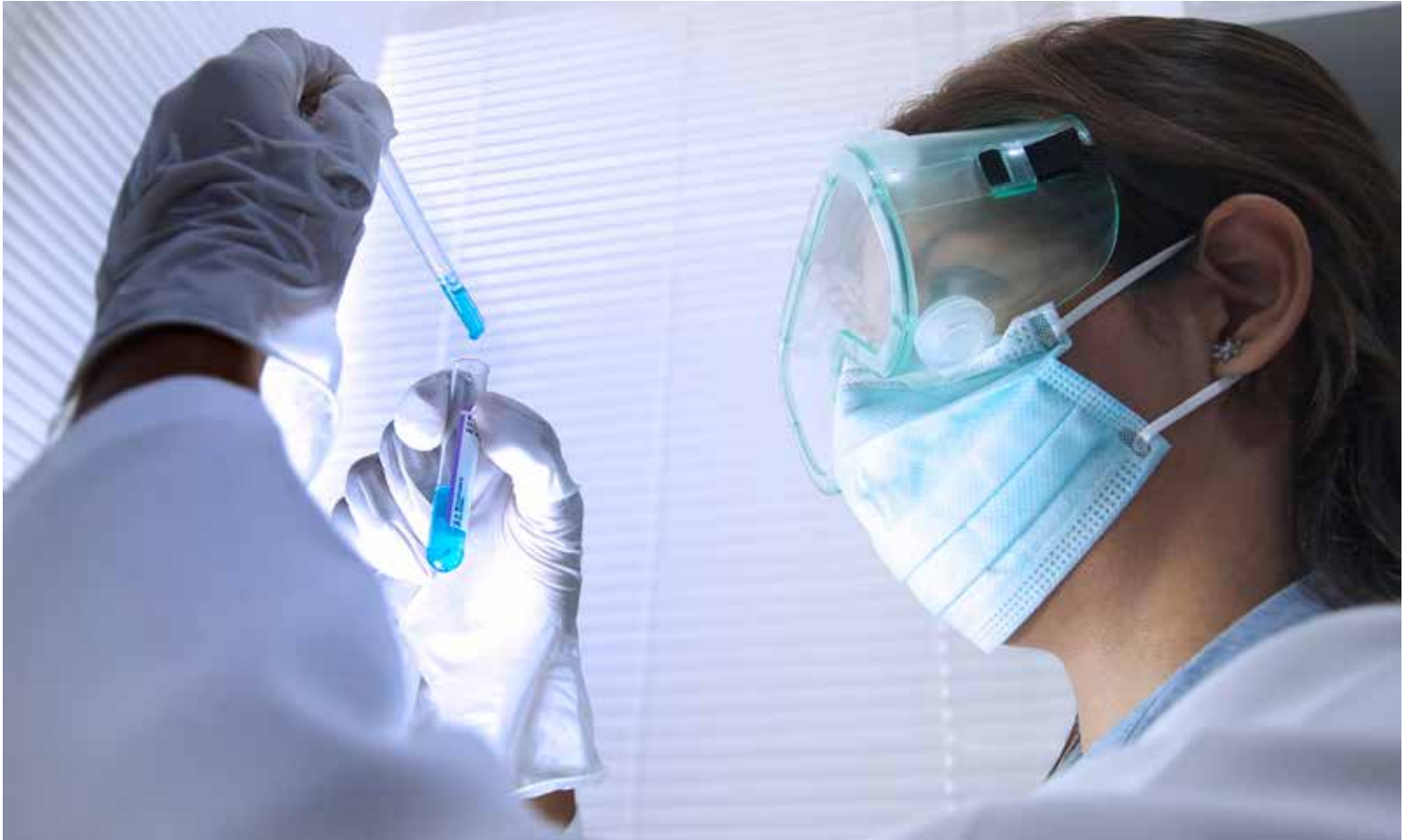
Investigación Científica, foto del Concurso Nacional de Fotografía Científica "FotoCiencia" de la SENACYT, Foto por: Yaribeth Hernández