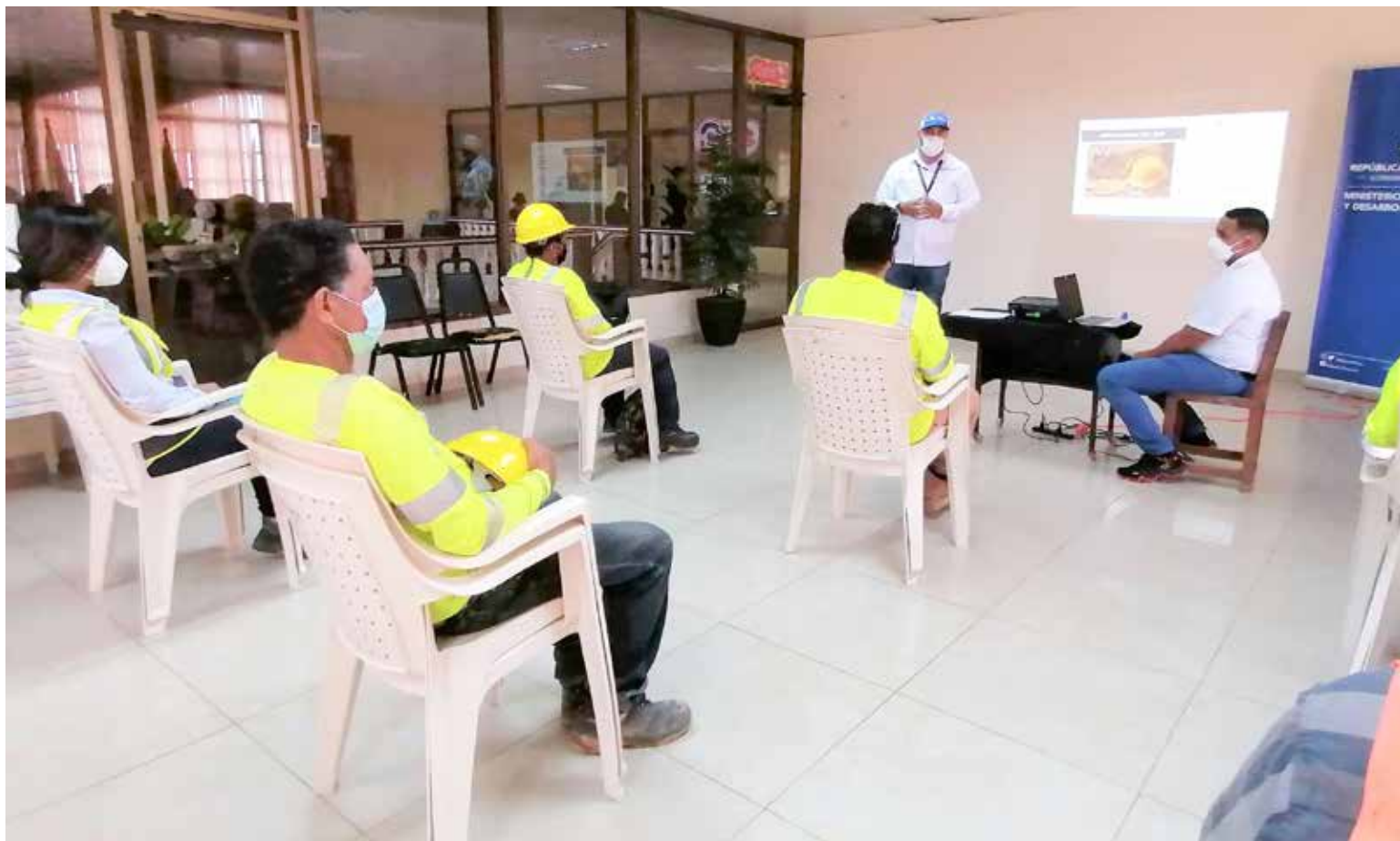
Trabajadores de Bocas del Toro se integran al programa Empleabilidad Comunitaria.