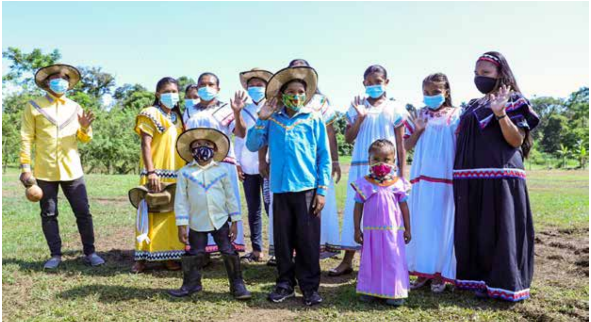
Unos 600 habitantes de Boca del Drago en Isla Colón pudieron encender un foco, tras la inauguración del tendido eléctrico por el presidente de la República, Laurentino Cortizo Cohen.