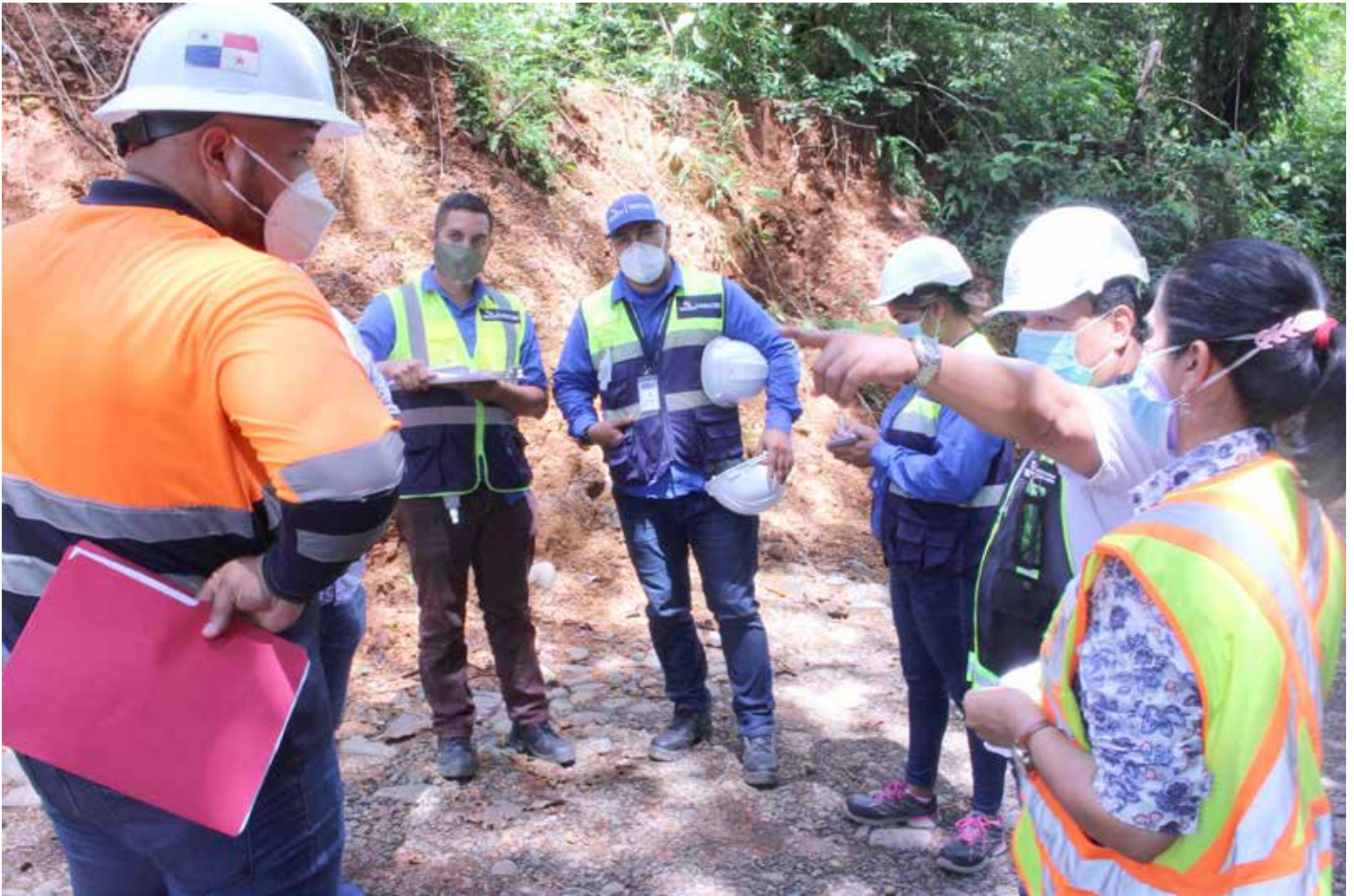
Mitradel inspecciona la obra en construcción del acueducto y carretera en la comarca Ngäbe Buglé.