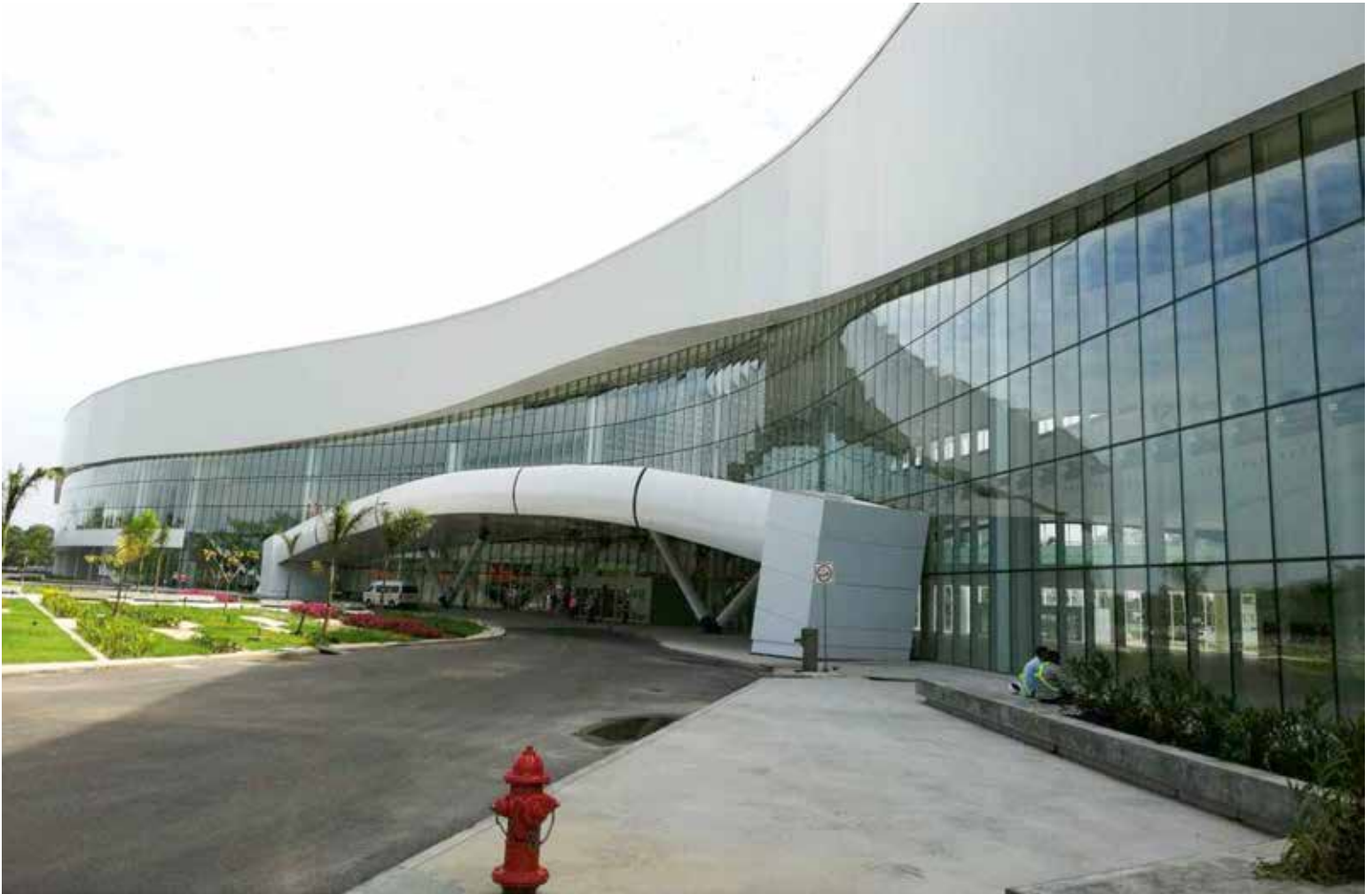
Panama Convention Center, competitividad en la región.