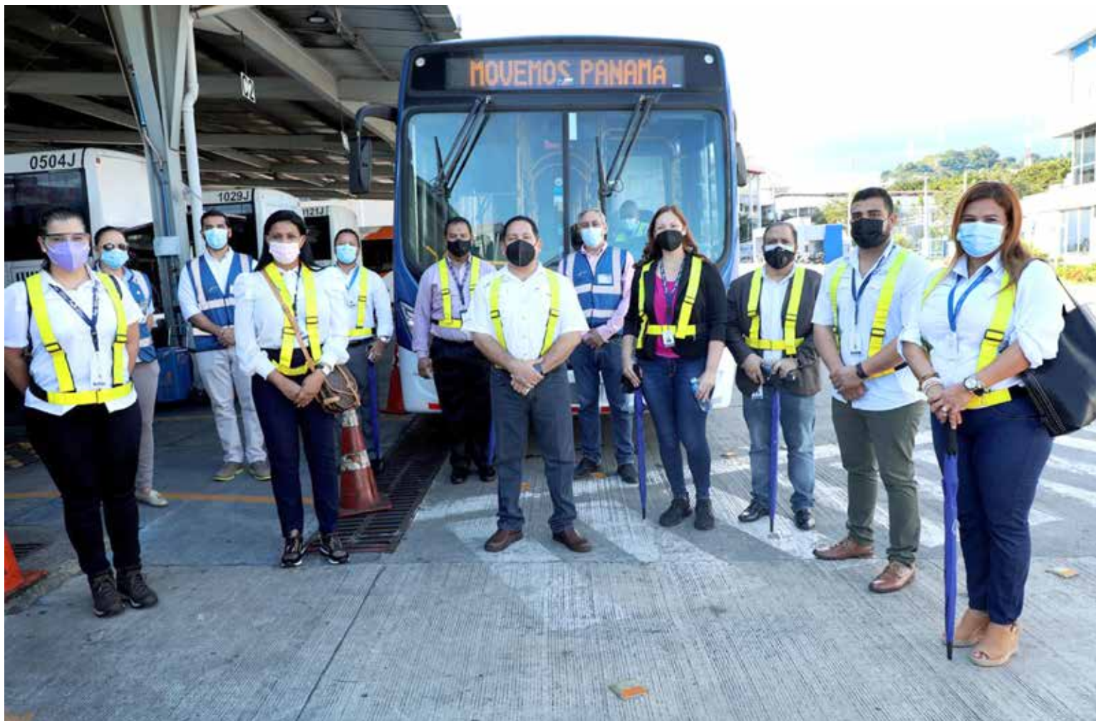
Equipo de Bienes Patrimoniales del MEF revisando las operaciones en MiBus.