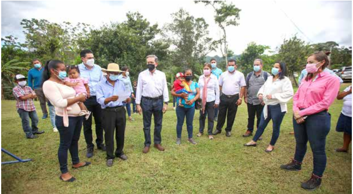
El presidente de la República, Laurentino Cortizo Cohen, y el vicepresidente, José Gabriel Carrizo Jaén, inauguraron el tendido eléctrico en la comunidad de Cirí Grande, en Capira, que beneficia a 700 personas.