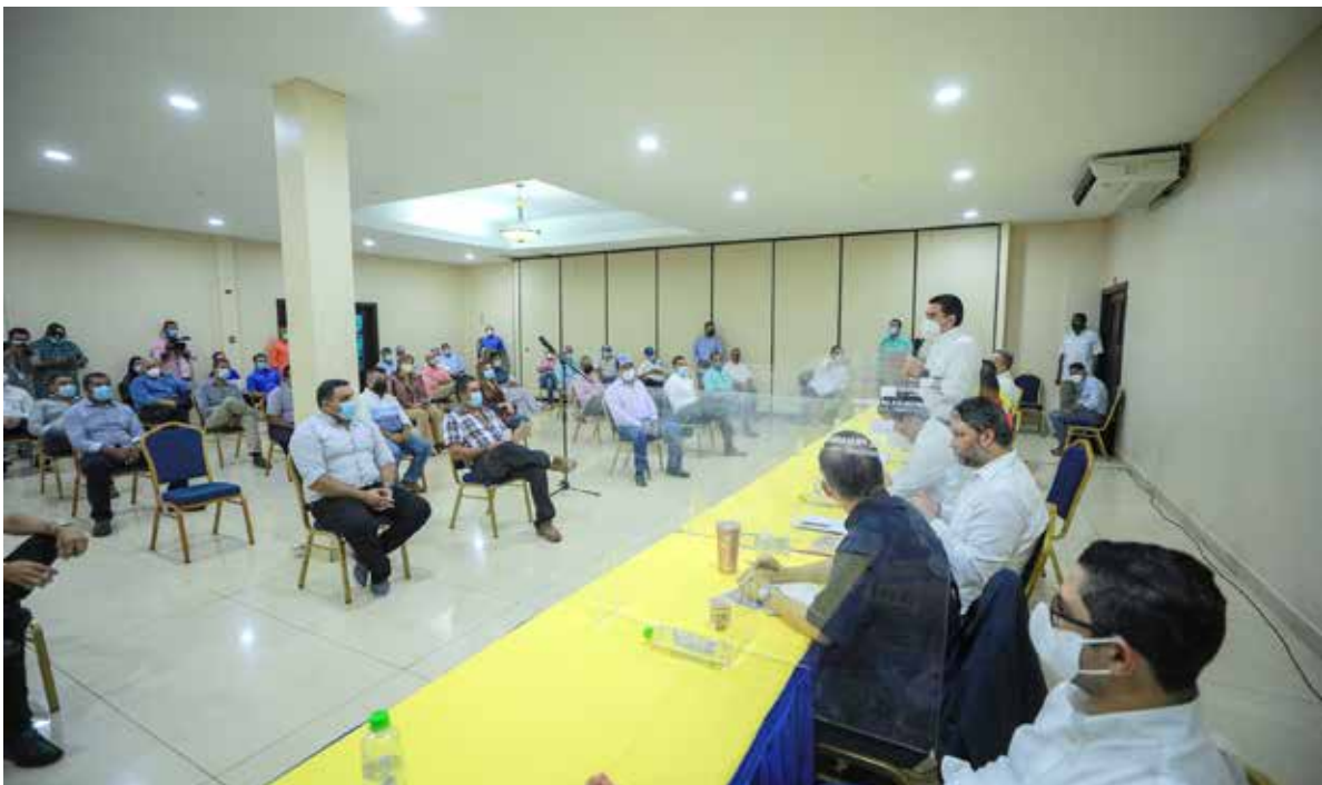
El Gobierno Nacional es un facilitador para ayudar a encontrar oportunidades para que la empresa privada genere empleos.